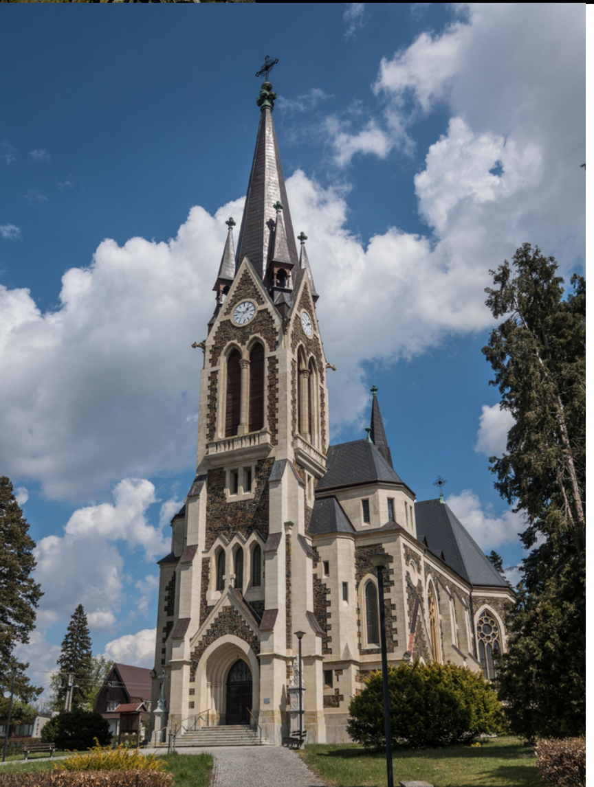
Novogotický farní kostel Nanebevzetí Panny Marie