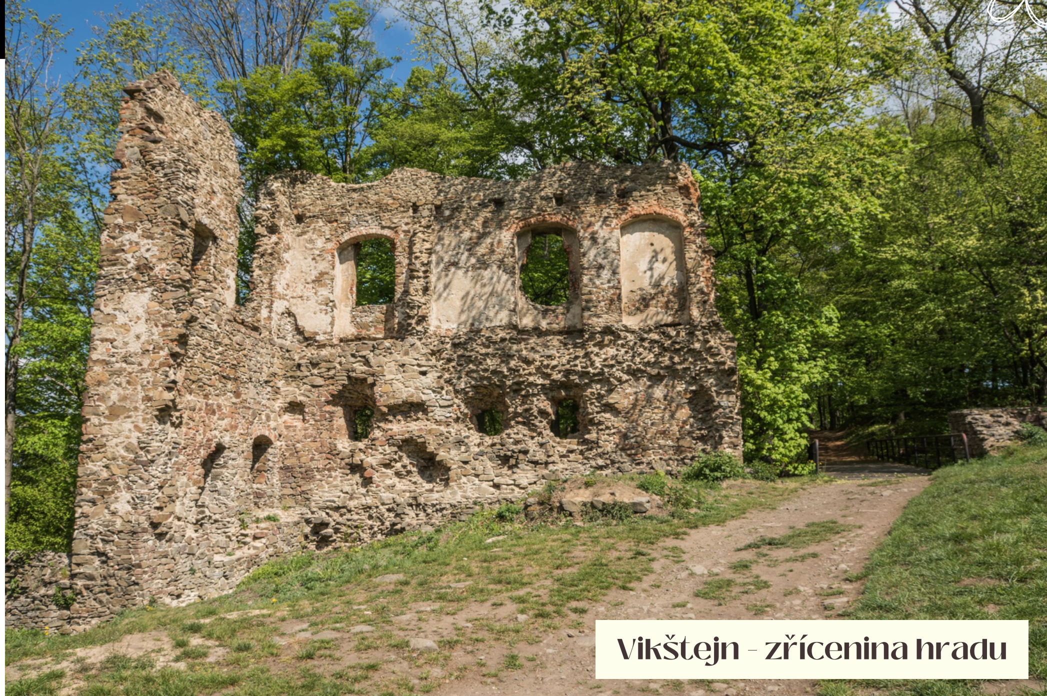
Vikštejn - zřícenina hradu